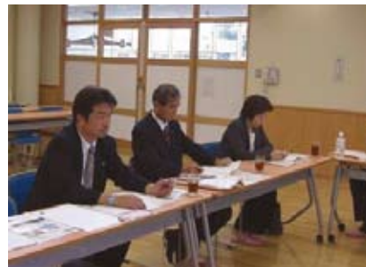
宇都宮にて障がい児福祉政策を学ぶ