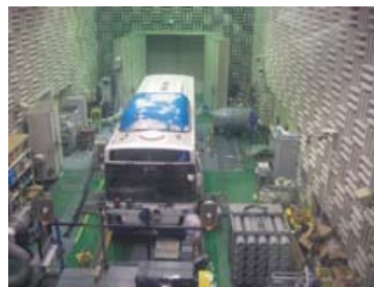
東京都にて排ガス検査施設を見学

調査報告をホームページ (活動報告内 = http://www.k-terada.jp/activities_report/activities_report_a_2007%20ko-usei%20iinkai.html ) にアップしましたのでよろしくお願い致します。