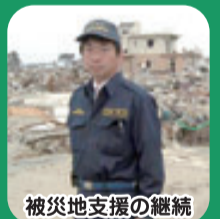
被災地支援の継続